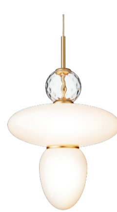
RIZZATTO 43 Satin Brass / Opal φ400 H626 TH2000 直付仕様 E26 LED60Wタイプ/電球別 250.000円 (税別) - 国内入荷済/即納可 -