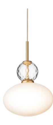
RIZZATTO 32 Satin Brass / Opal φ300 H448 TH2000 直付仕様 E26 LED60Wタイプ/電球別 130.000円 (税別) - 国内入荷済/即納可 -

今回の Paolo Rizzato とのコラボレーションは、NUURA のコレクションに多様性を持たせ、より豊かなものにしてくれました。