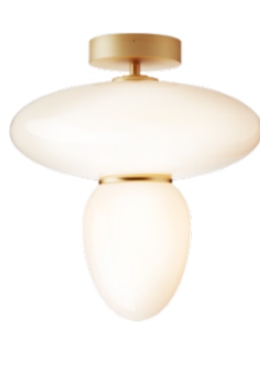
RIZZATTO 42 Satin Brass / Opal φ400 H449 直付仕様 E26 LED60Wタイプ/電球別 160.000円 (税別) - 国内入荷済/即納可 -