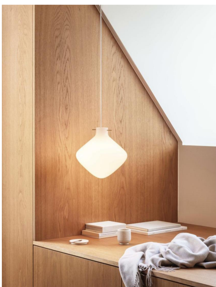
REPOSE 260 BRASS