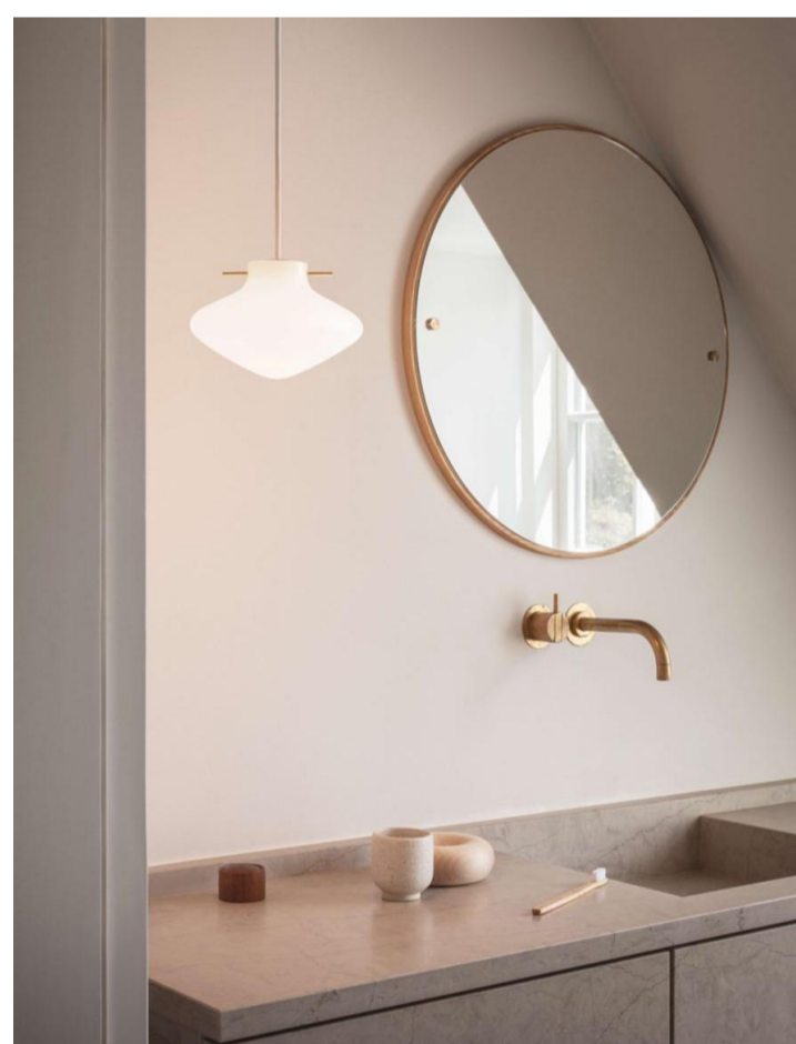
REPOSE 175 BRASS