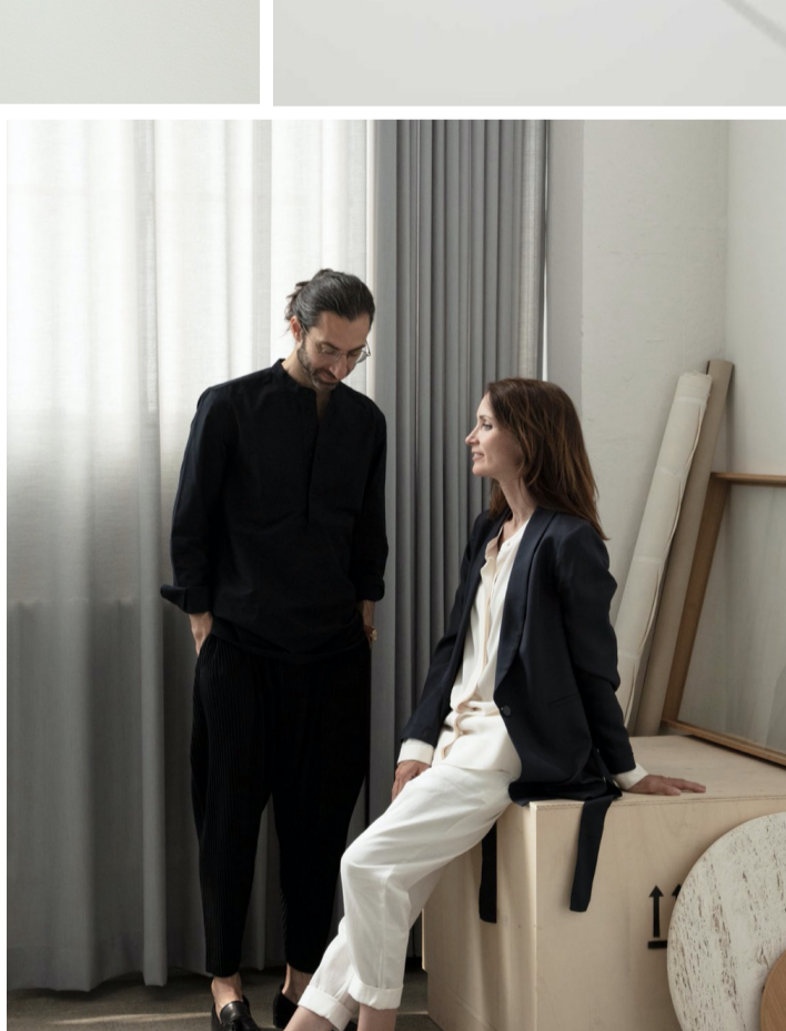
Designer - GamFratesi